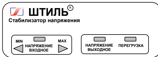
Рисунок 4.1 Передняя панель стабилизатора

На одной боковой стенке стабилизатора расположена розетка с заземляющим контактом для подключения нагрузки, а на другой – автоматический предохранитель 2А (у стабилизатора R250T) или 5А (у стабилизаторов R400T, R600T), или 10А (у стабилизатора R800T), выключатель СЕТЬ и выведен сетевой шнур для подключения стабилизатора к сети.